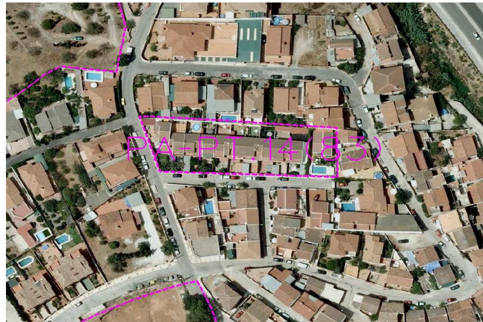
Ordenación Pormenorizada Completa

Plan Especial de Infraestructuras Básicas: